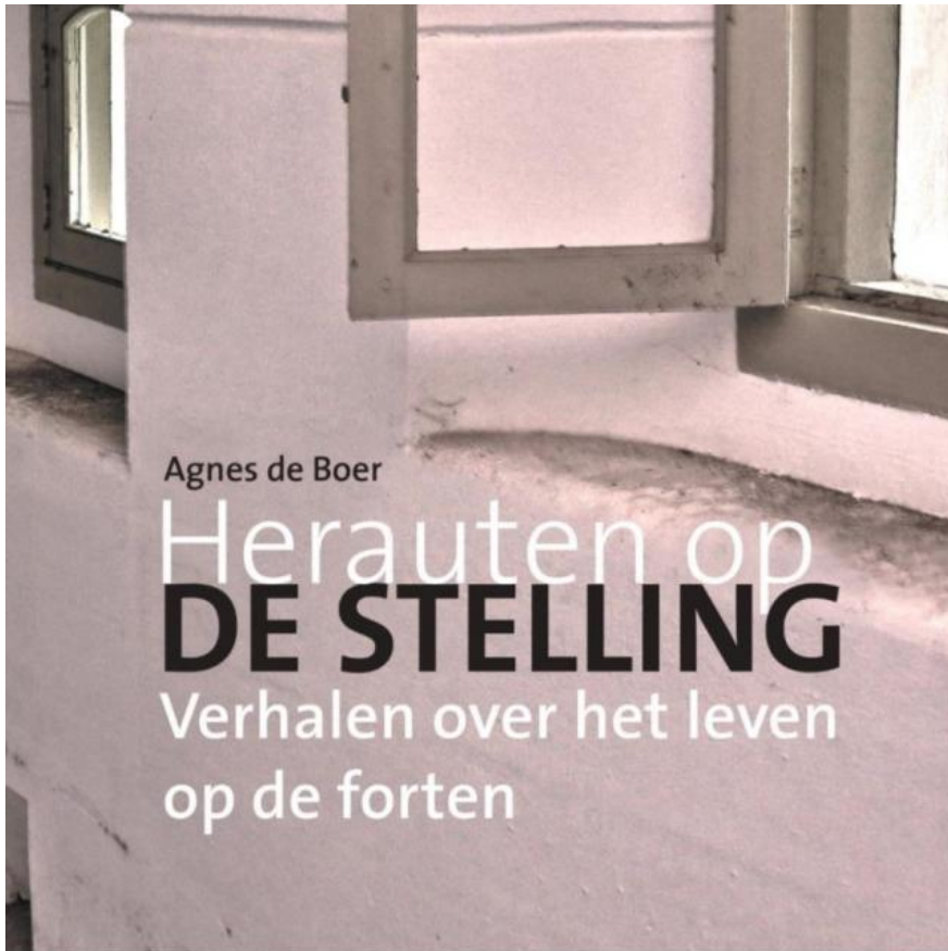
Cover van het boek 'Herauten op de Stelling' (deel IV)